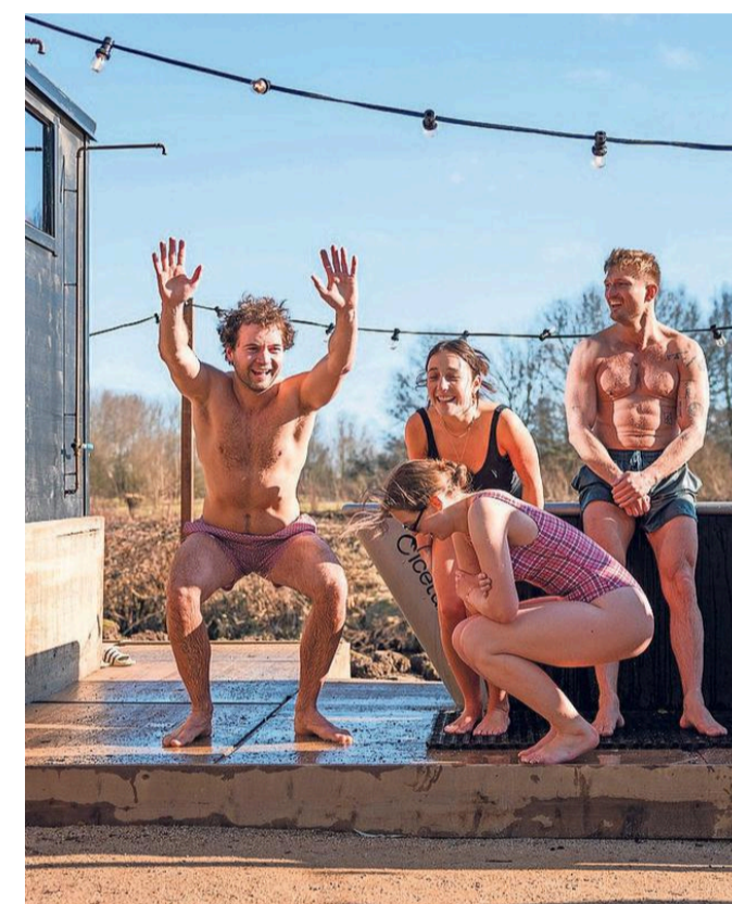
Vrijdagmiddagborrel of festival: er komen steeds meer concepten.