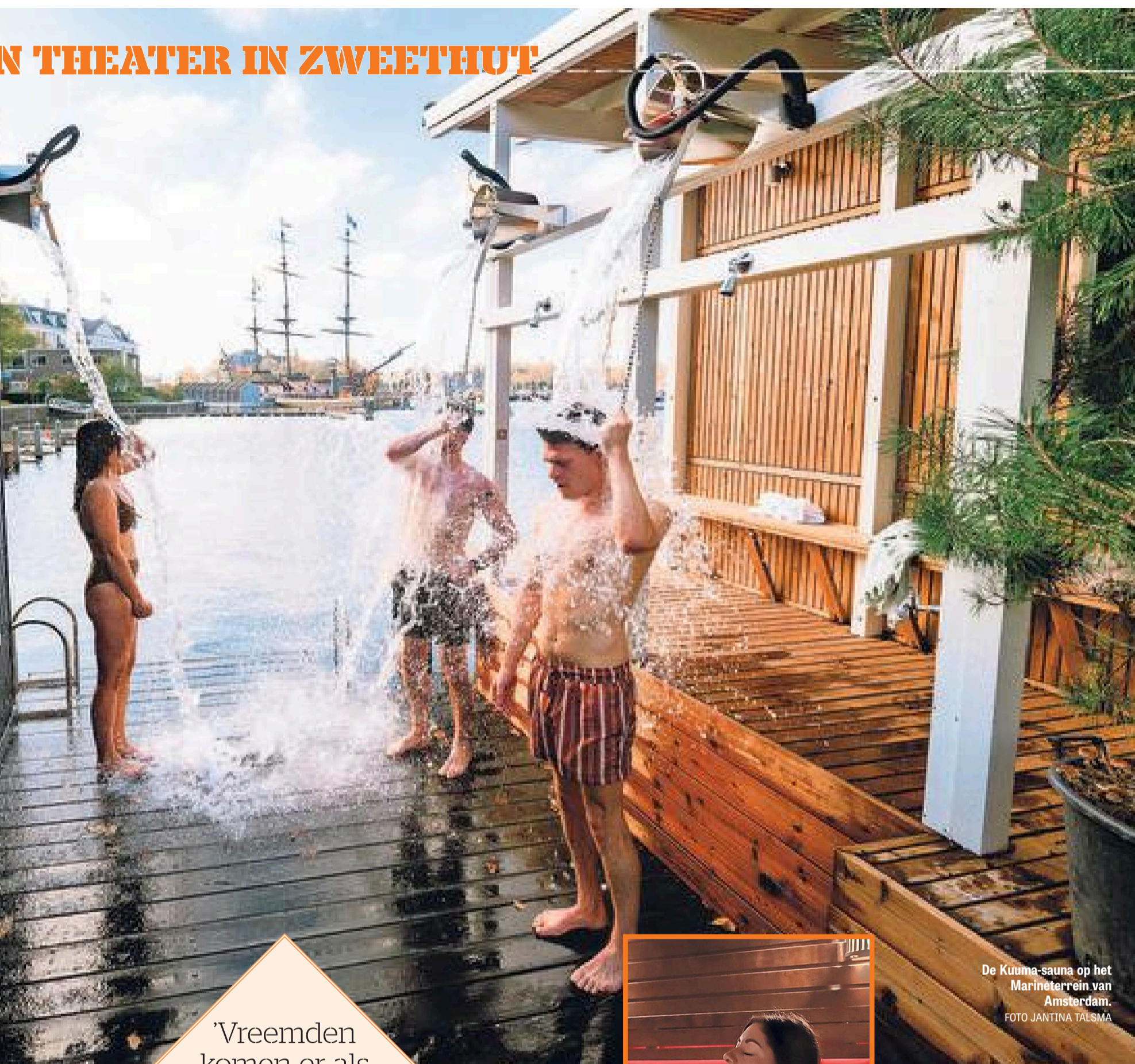
De Kuuma-sauna op het Marineterrein van Amsterdam.