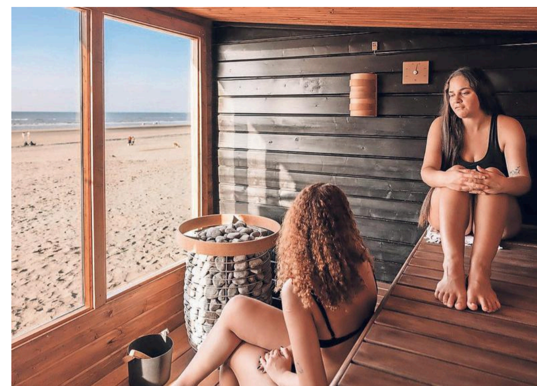
Billies Beach Sauna is een proef op het strand van Zandvoort.

Het tweetal is ervan overtuigd dat we in de toekomst, net als steeds meer Britten, steeds meer naar de sauna gaan in plaats van naar de kroeg. „We